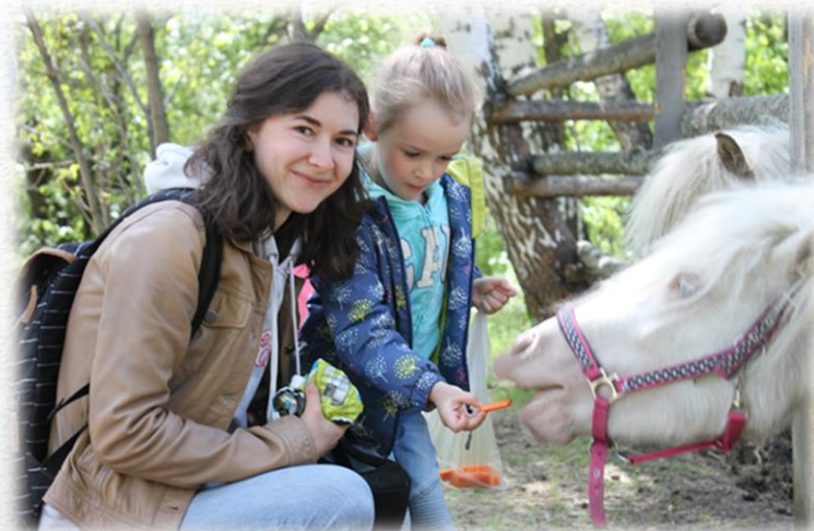
Парк для животных