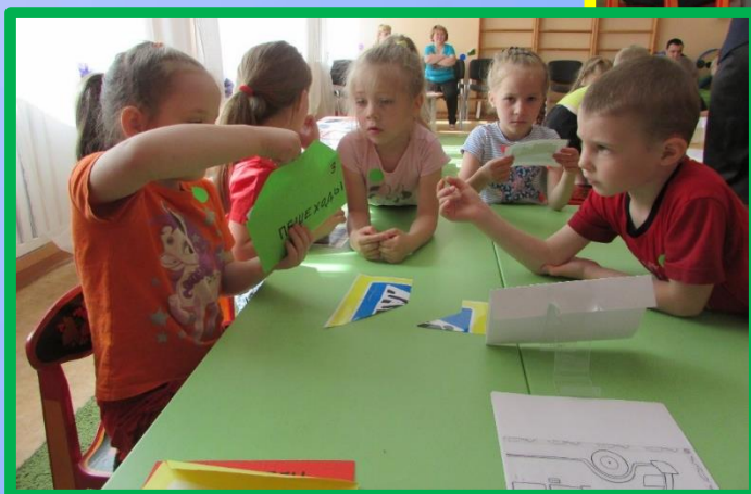
Работа в командах