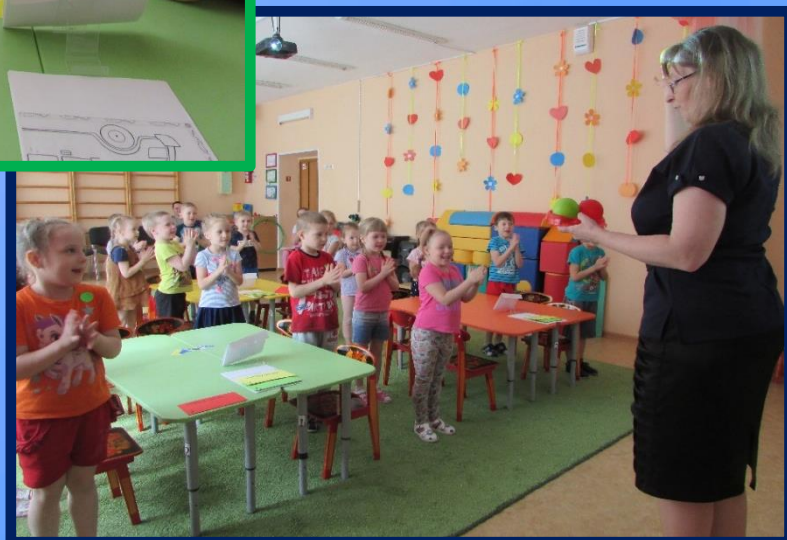
Игра «Сигналы светофора»